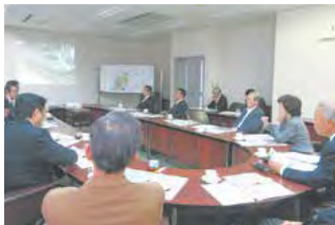
議会報告運営委員会（大牟田市視察）