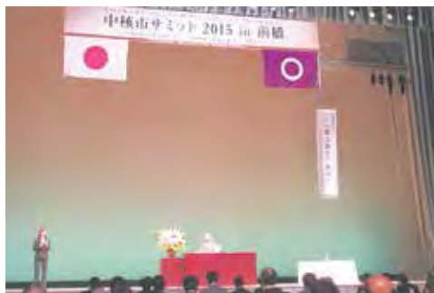
中核市サミット（前橋市）