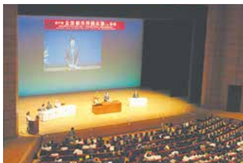
全国都市問題会議（長野市）