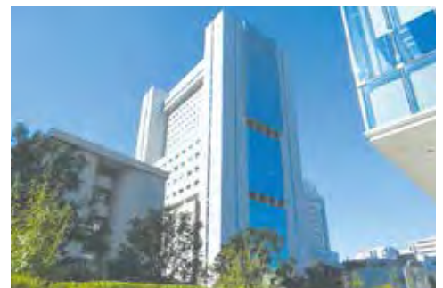
福山市東京事務所（都市センターホール）