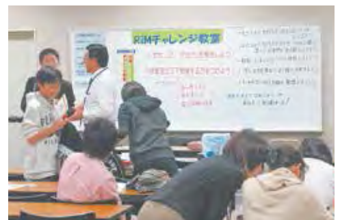
土曜チャレンジ教室