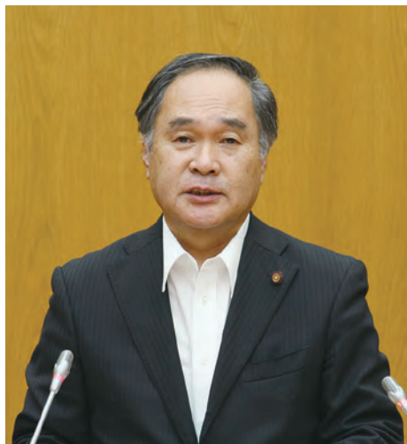
写真1 6月議会一般質問